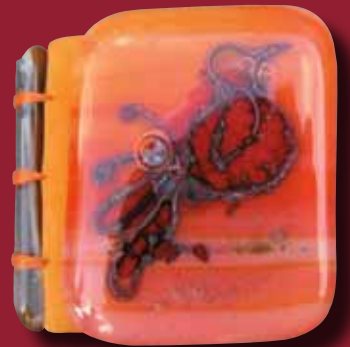
MINIATUURBOEKJES ONDER DE LOEP