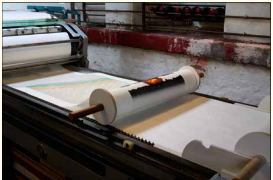
Voorzichtig wordt de rol door de pers geleid.