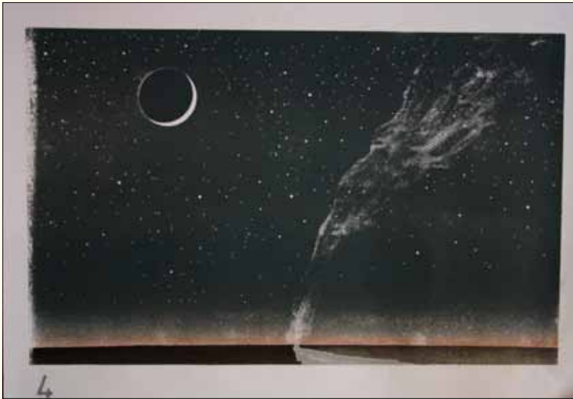
'Melkweg met maan', prent bij het subthema 'Gesternte' uit het verhaal van de schepping.

hij op betontriplex verlijmt. Dat biedt de mogelijkheid tot verschillende technieken: lino-snede, puzzeltechniek en sjabloonteknik.