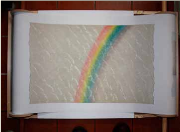
Prent uit het verhaal van de schepping bij het subthema 'Geest'.

die omgebouwd tot pers. Zo oefende ik in het maken van prenten.' Tegelijkertijd schreef hij gedichten, iets waar hij tijdens z'n studie al mee was begonnen. Ook daarbij ging hij planmatig te werk. 'Ik ben een poos in Amerika geweest en daar kun je Poetry studeren. Dus bestaan er handboeken over. Die heb ik bestudeerd.'