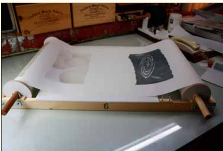
Het gedicht 'Geest' wordt tussen de beide beelden gedrukt. Bij elkaar vormt het drukwerk de uitwerking van het onderwerp 'Geest' uit het verhaal van de mens.