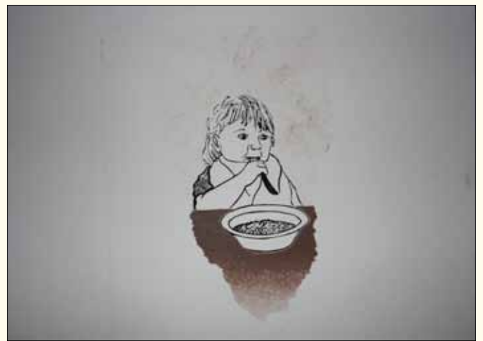
Prenten bij subthema 'Gesternte' uit het verhaal van de mens, links een ondervoed kind uit Afrika en rechts een 'papkind'. Het gedicht dat ertussen komt, moet nog worden geschreven.

Behalve met de technische aspecten hield hij zich ook al gauw bezig met het ontwerpen van de prenten. Zoals bij eerdere prenten richtte hij zich eerst op het beeld. Hiervoor maakt hij gebruik van linoleum dat